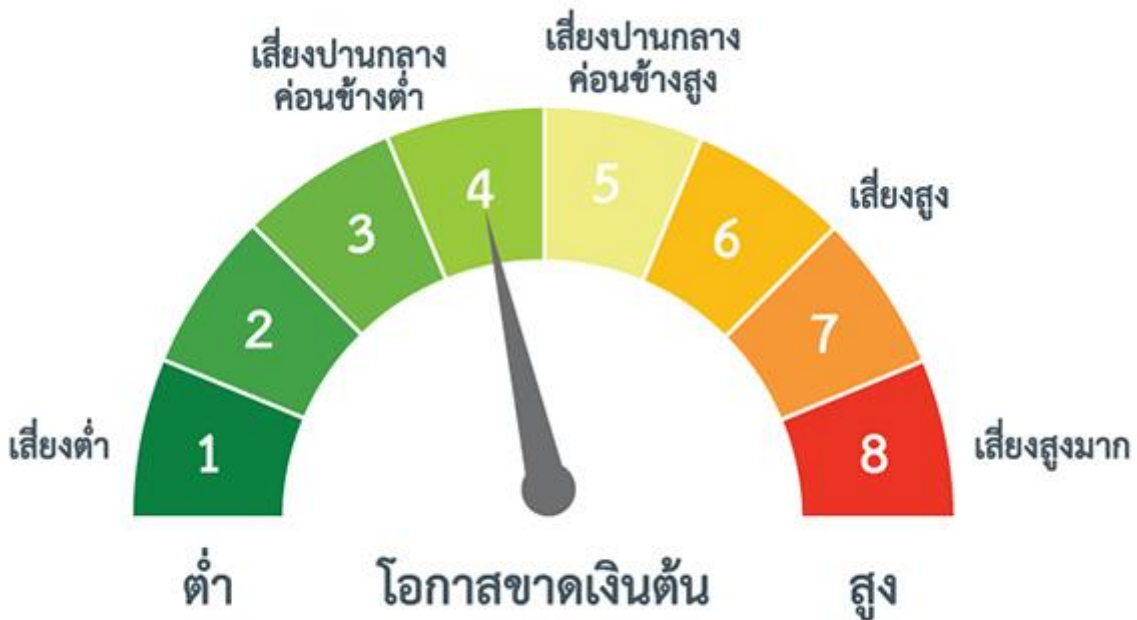
แผนภาพแสดงตำแหน่งความเสี่ยงของกองทุนรวม

ป้องกันความเสี่ยงทั้งหมดหรือเกือบทั้งหมด : ผู้ลงทุนไม่มีความเสี่ยงจากอัตราแลกเปลี่ยน