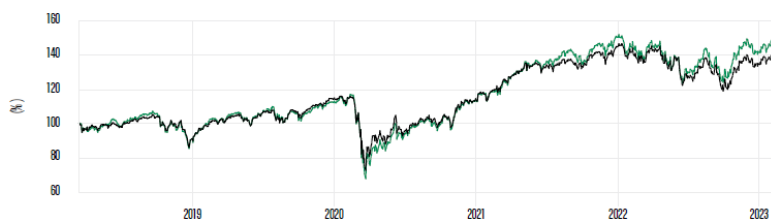
Cumulated Performance at 28.02.2023 (%)