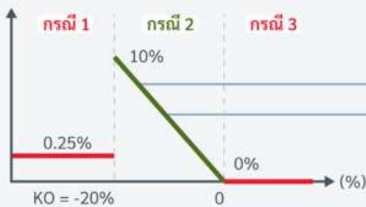
ผลตอบแทนวอร์แรนท์ ณ วันครบกำหนดอายุ

ในกรณีที่ดัชนีอ้างอิงปิดตั้งแต่ -20% ถึง 0% Pay-off = ค่าสัมบูรณ์ (Absolute) ของผลตอบแทนของดัชนีอ้างอิง x อัตราการมีส่วนร่วม